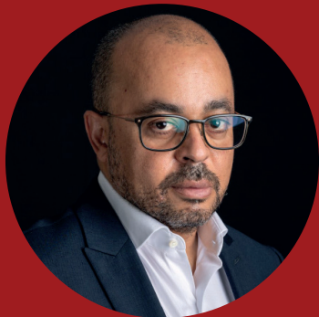
Pr Medhi Karkouri Président de Coalition PLUS depuis 2022