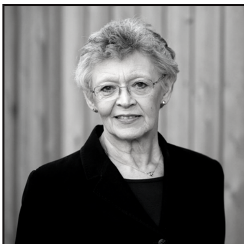
La Prof. Françoise Barré-Sinoussi